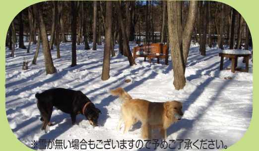
※雪が無い場合もございますので予めご了承ください。