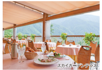
スカイガーデンテラス