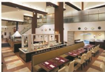
バイキングレストラン