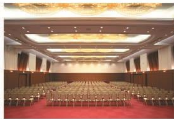
研修会場・宴会場